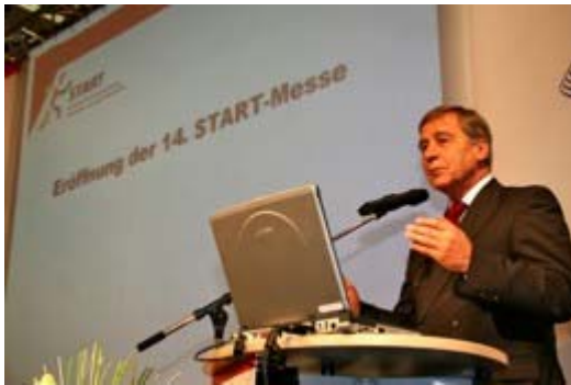
Bild 1: Wirtschafts- und Arbeitsminister Wolfgang Clement eröffnete als Schirmherr gemeinsam mit dem Umwelt- und Verbraucherschutzminister des Landes NRW Eckhard Uhlenberg die diesjährige 14. START-Messe 2005 in Essen

An der diesjährigen 14. START-Messe 2005 - bundesweite Leitmesse für Existenzgründung, Franchising und junge Unternehmen mit Wolfgang Clement (Bundesminister für Wirtschaft und Arbeit, Berlin) als Schirmherr und Christa Thoben (Ministerin für Wirtschaft, Mittelstand und Energie des Landes Nordrhein-Westfalen) als Schirmdame beteiligten sich insgesamt 345 Aussteller 2 (Vorjahr: 306 Aussteller). Es kamen insgesamt mehr als 12.000 Besucher 2 im Messezeitraum vom 21. bis 23. Oktober 2005 nach Essen (s.a. Bild 1 und Bild 2).