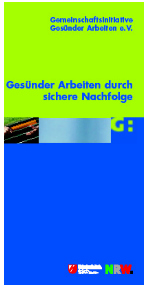
Bild 4: Aktueller GiGA-Folder Gesünder Arbeiten durch sichere Nachfolge