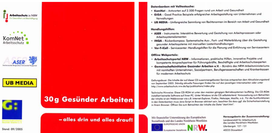
Bild 6: CD-ROM "30 g Gesünder Arbeiten – alles drin und alles drauf!" (LaFA NRW, 2005)